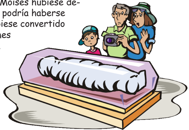
Moisés escoge entre esto (foto de arriba) o esto (foto debajo) sobre como le gustaría ser recordado.

Piensa en este planteamiento por un momento. Si Moisés hubiese decidido continuar viviendo en el palacio del Faraón, podría haberse convertido en rey sobre todo Egipto. Si no se hubiese convertido en rey, probablemente podría haber tenido enormes riquezas, fama y poder en Egipto mientras viviera, pero ¿quién se habría acordado de él después de su muerte? La única manera en que hubiese alcanzado la fama hubiera sido como una momia en un museo. ¿Cuántos nombres de los Faraones tu sabes? Si Moisés se hubiese convertido en un Faraón, ¿cuántas personas tendrían su nombre? Sin embargo, ¿cuántos billones de personas a través de la historia han sabido acerca de Moisés solo porque él decidió obedecer a YHVH y han leído acerca de él en la Biblia?